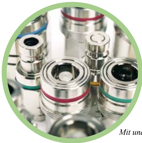
Mit und ohne Ventil

Sie können bei der Flüssigkeitsserie zwischen Kupplungen und Nippeln mit und ohne Ventil wählen. Dadurch ergeben sich weitere Anwendungsmöglichkeiten. Die für Flüssigkeiten gebräuchlichste Version mit Ventil ist einhändig bedienbar. Aufgrund ihrer Konstruktion erfordern die