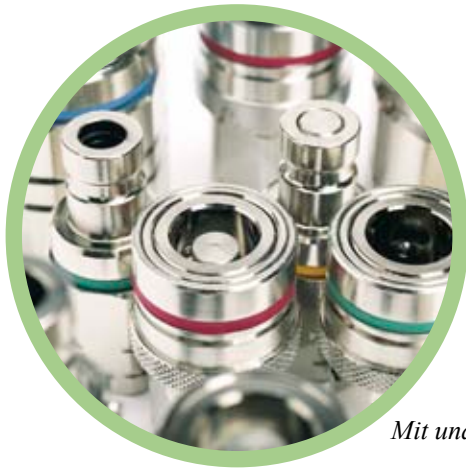
Mit und ohne Ventil

Sie können bei der Flüssigkeitsserie zwischen Kupplungen und Nippeln mit und ohne Ventil wählen. Dadurch ergeben sich weitere Anwendungsmöglichkeiten. Die für Flüssigkeiten gebräuchlichste Version mit Ventil ist einhändig bedienbar. Aufgrund ihrer Konstruktion erfordern die